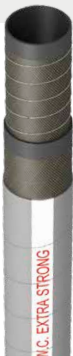
SANITARI / WC