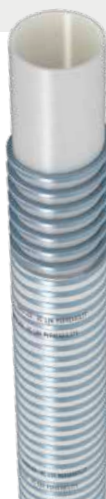
SANIFLEX / WC

Thanks to continues resources to improve and to give the best and innovate solution to our customers, we have developed and identified a new anti-odour system for our sanitary pvc hoses: THE MULTILAYER BARRIER SYSTEM!