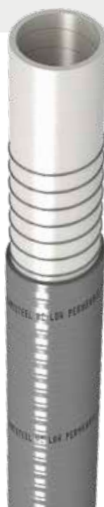
SANISTEEL / WC